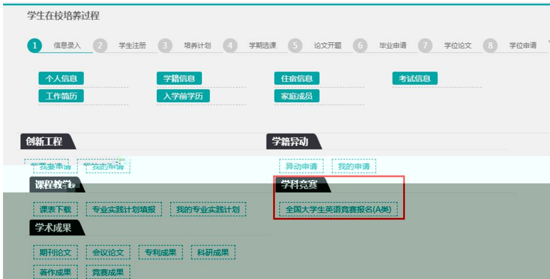
报名界面（2016 级以后研究生）